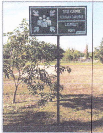
Gambar 3. Titik Kumpul Keadaan Darurat di depan gedung balai

Dalam keadaan darurat, telah juga dibuatkan jalur evakuasi. Jalur Evakuasi adalah jalur khusus yang menghubungkan semua area ke area yang aman (Titik Kumpul). Titik kumpul berada pada lapangan di depan kantor utama BBPP Kupang.