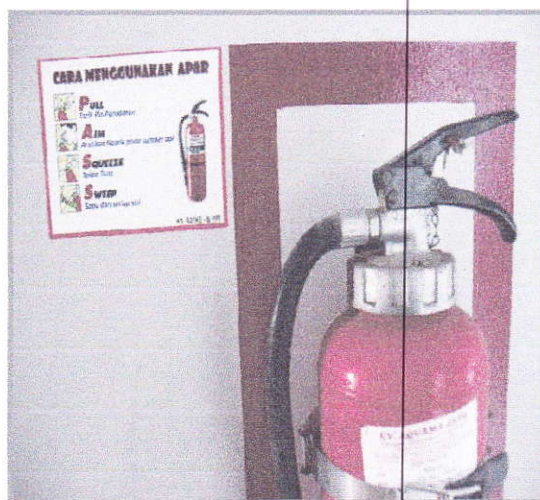
Gambar 2. Rencana kebutuhan APAR di perkantoran balai

Manajemen keselamatan dan kebakaran gedung BBPP Kupang dilakukan bekerjasama dengan satpam dan pihak terkait. Tahun 2018, balai akan melakukan kebutuhan inventarisasi terhadap Alat Pemadam Api Ringan (APAR) yang tersedia di lingkungan perkantoran serta pemasangan petunjuk penggunaan APAR yang benar. Selain itu, para satpam diprioritaskan mengikuti sosialisasi pengelolaan kebakaran yang dikelola oleh instansi terkait.