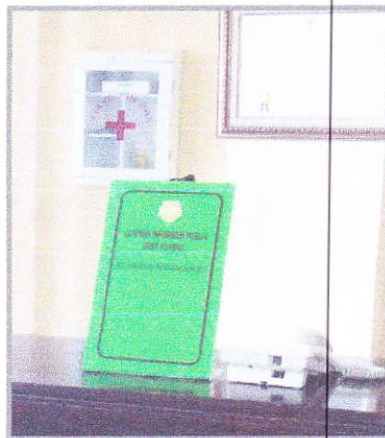
Gambar 4. Kotak P3K di lobby balai

Untuk pertolongan pertama pada kecelakaan, balai menyediakan pengobatan dasar (kotak P3K), dan jika terjadi hal yang tidak bisa ditangani dibawa ke puskesmas terdekat (Puskesmas Tarus, Kab. Kupang).